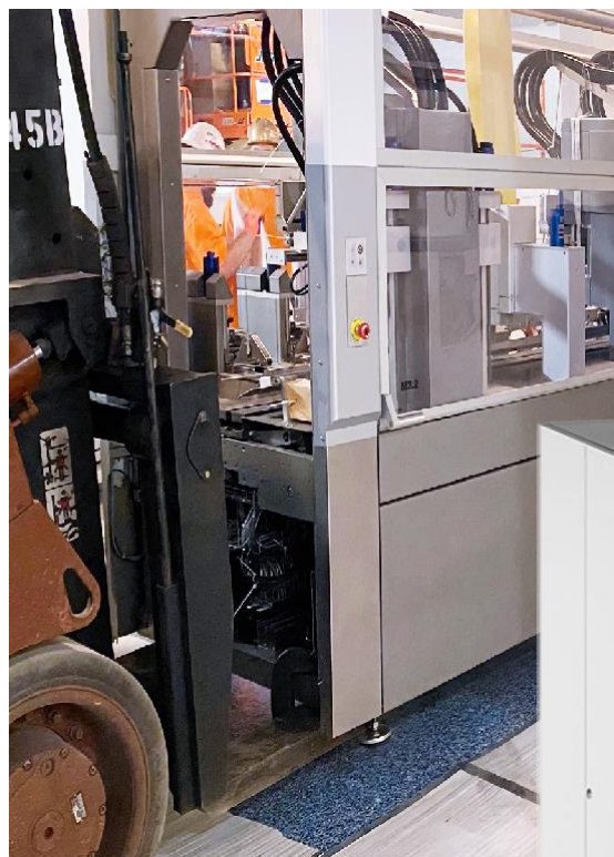
迪威德拉NeoTOP 1604在 康泰伦特的美国工厂 进行安装