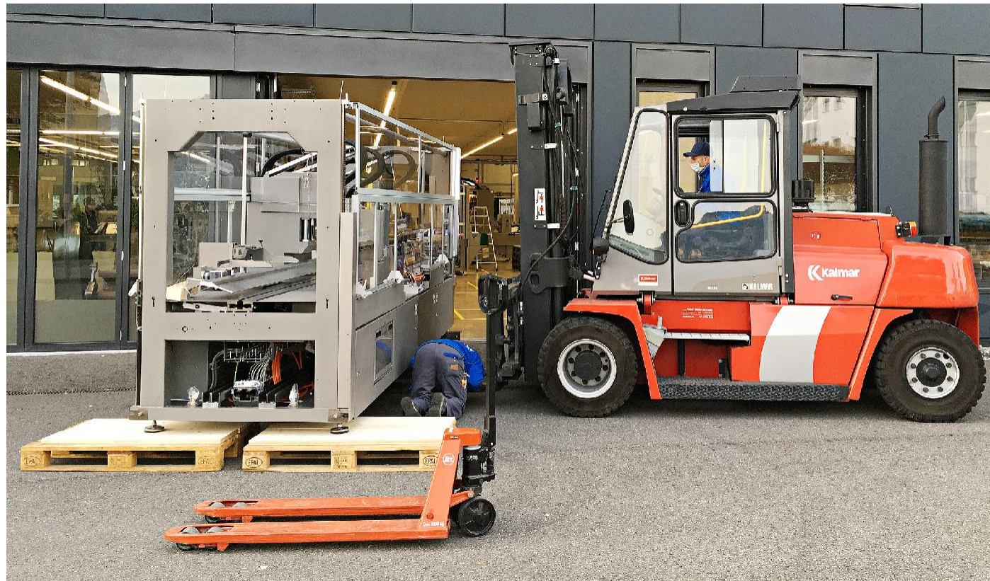
在瑞士工厂装运机器