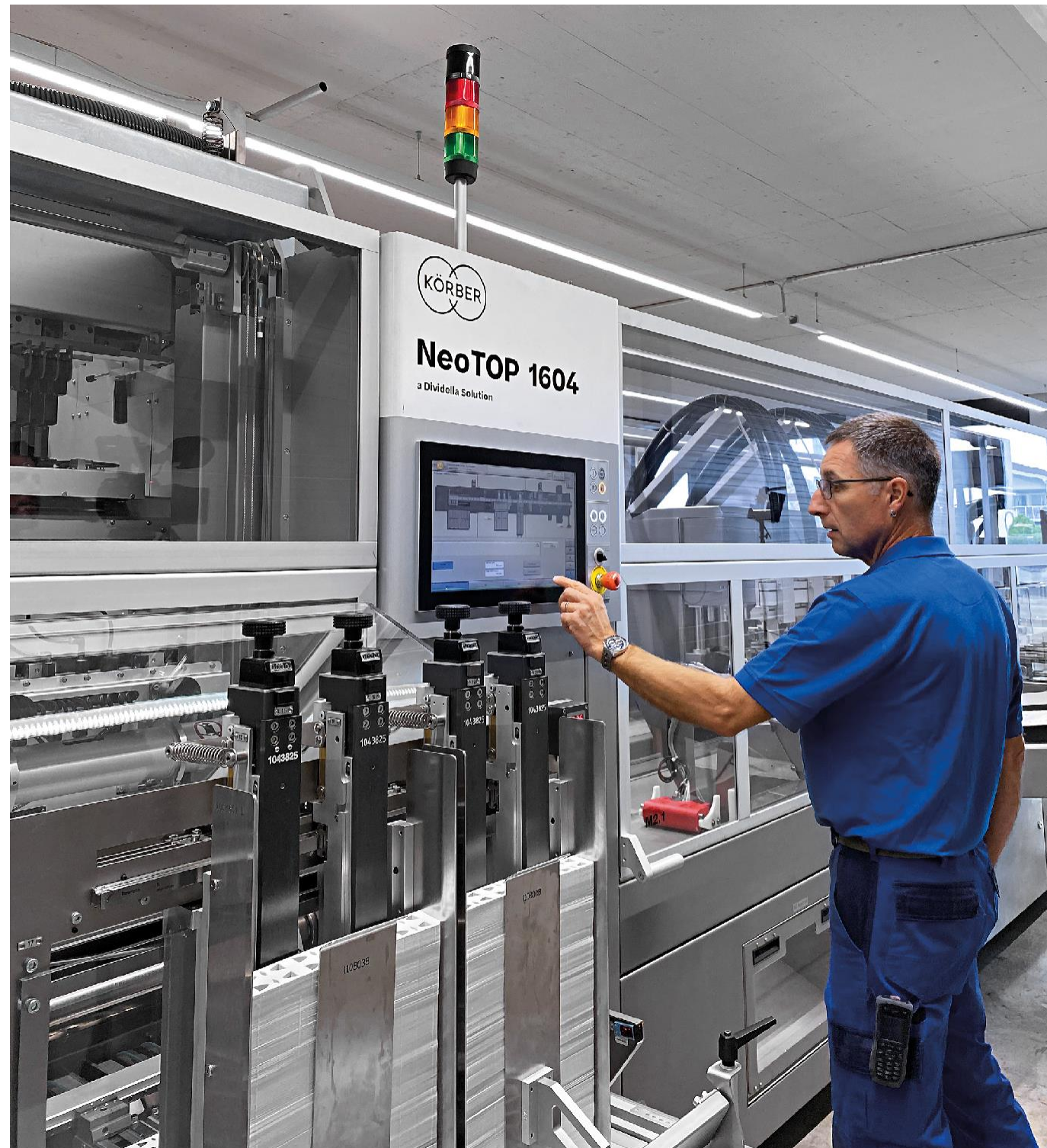
机器在Grabs验收前的状态

为了能够满足康泰伦特客户的庞大产量和紧凑的生产计划，他们在寻找合作伙伴时特别选择了柯尔柏在瑞士的上装式包装专家。康泰伦特工厂需要增加一台高速包装机，它须确保包装设计紧凑，同时提供高水平的产品保护。